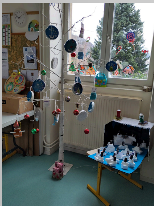
Paysages et animaux de l'Arctique