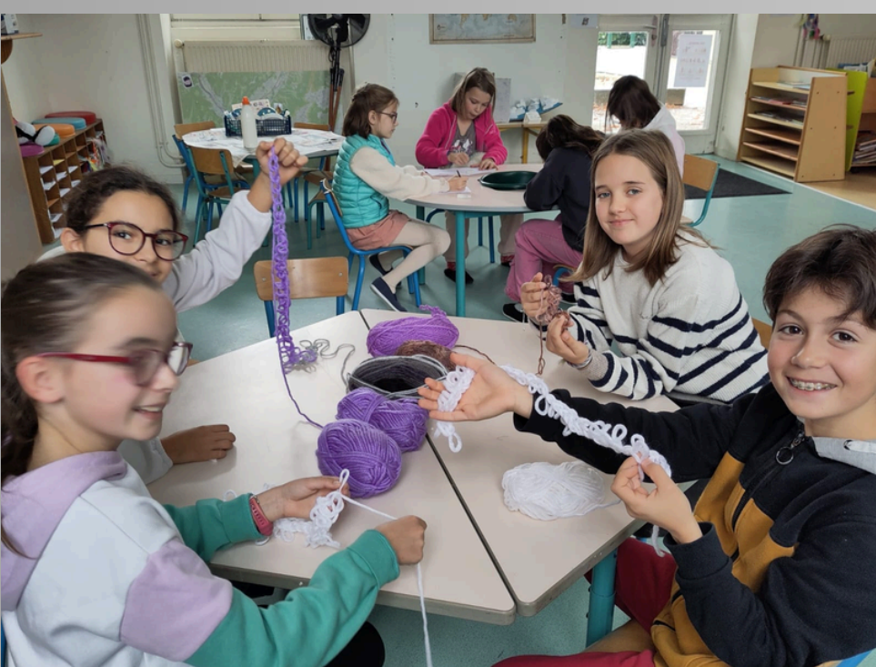
Découverte du crochet