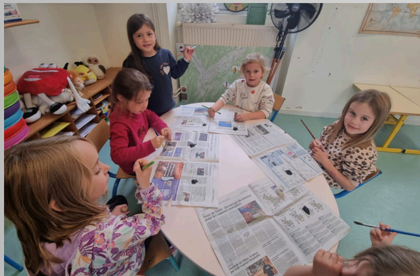
réalisation d'une maquette de la banquise et ses pingouins