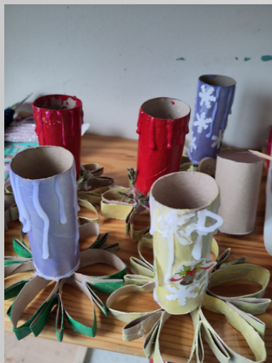
bricolages de Noël