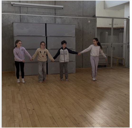
répétition de la vidéo : danses de l'Arctique